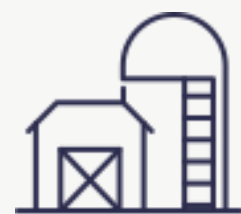
Крупные трейдеры (места хранения)