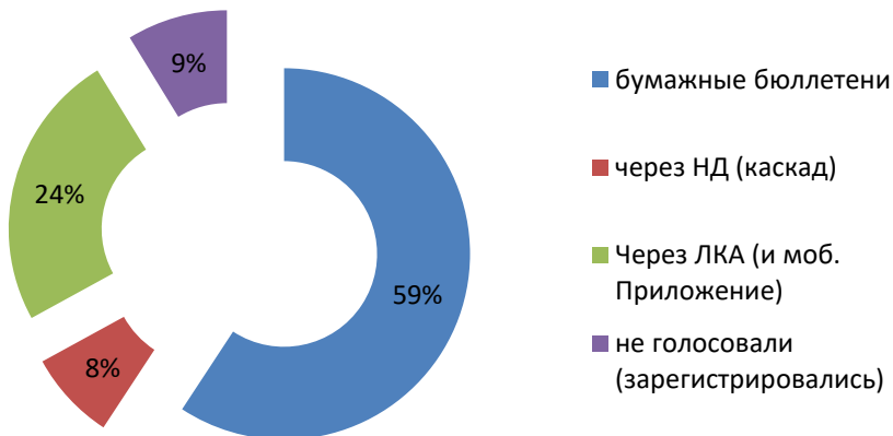
ПАО "Интер РАО" ГОСА 2018