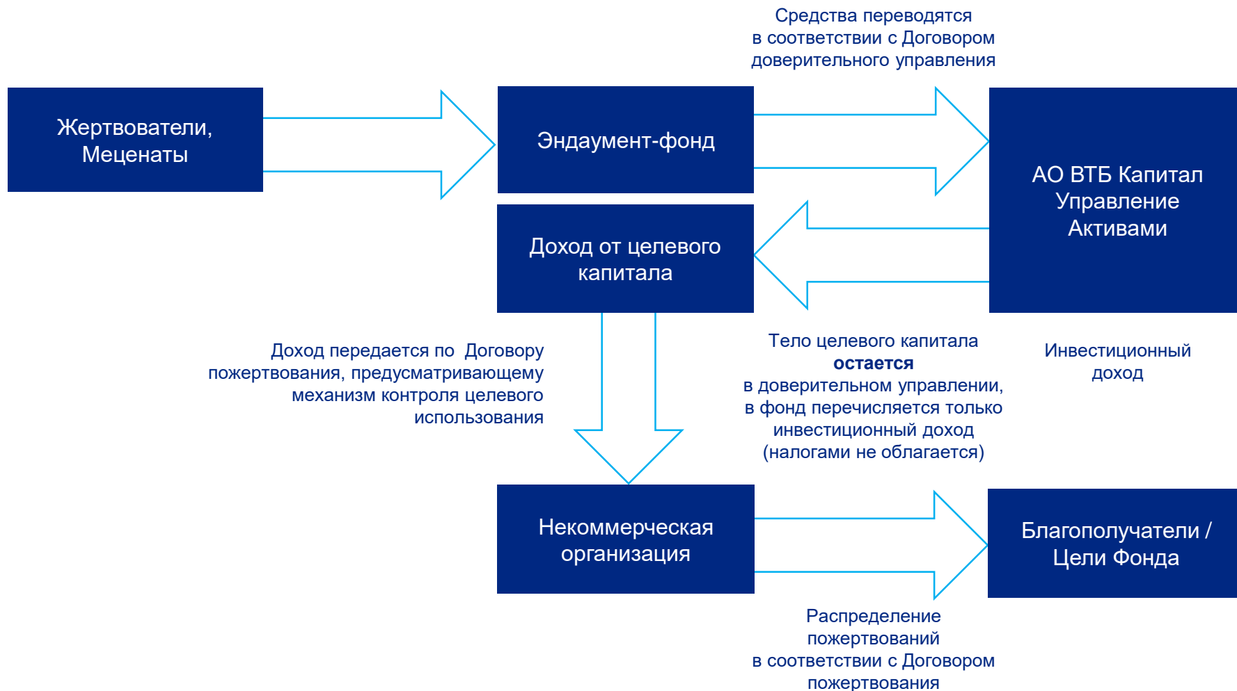
СХЕМА РАБОТЫ ЭНДАУМЕНТ-ФОНДА