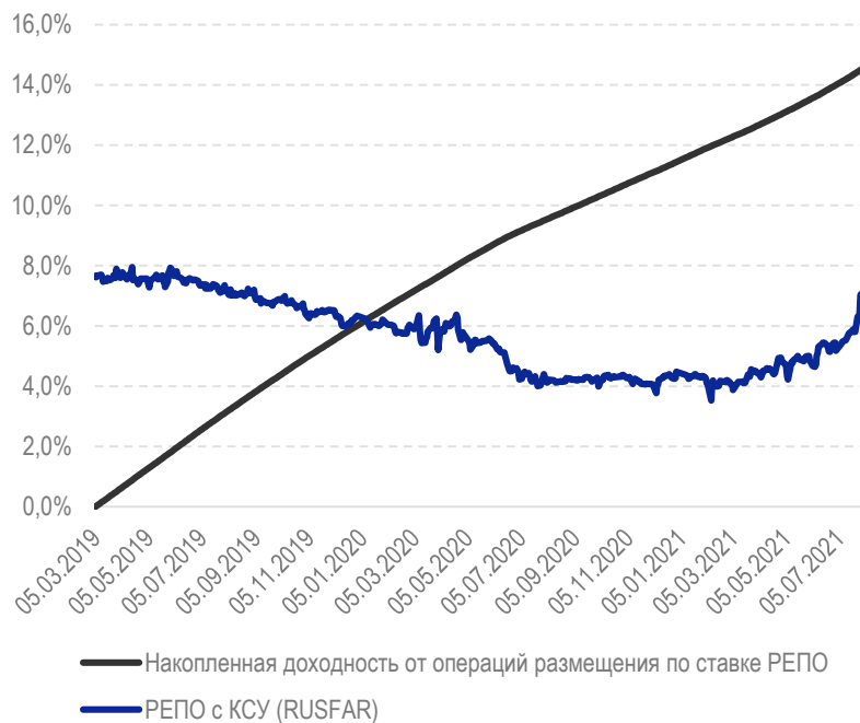
ДИНАМИКА СТАВКИ ОДНОДНЕВНОГО РЕПО И НАКОПЛЕННАЯ ДОХОДНОСТЬ ОТ ОПЕРАЦИЙ РАЗМЕЩЕНИЯ