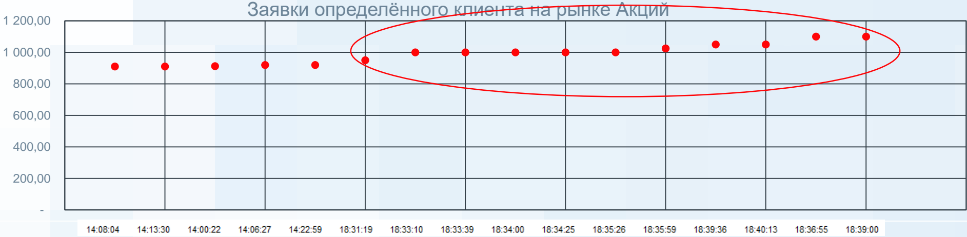
График подачи клиентом заявок на покупку акций LENT 03.04.2024

Серия однонаправленных крупных заявок под конец торговой сессии, которые дестабилизировали рынок акций LENT 03.04.2024 во временном интервале с 18:31:19 по 18:39:00.