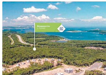
О. РУССКИЙ, ВЛАДИВОСТОК