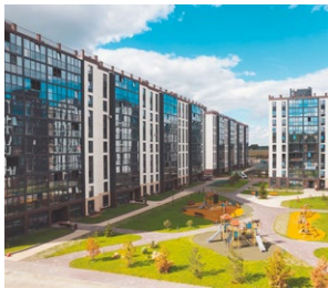
ПАРКОВЫЙ ПРЕМИУМ, ЧЕЛЯБИНСК