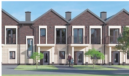
МАЛЫЙ ИСТОК, ЕКАТЕРИНБУРГ