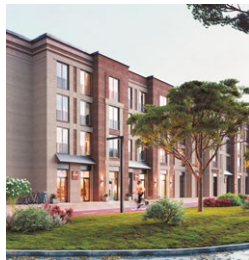
ТВОЯ ПРИВИЛЕГИЯ, ЕКАТЕРИНБУРГ