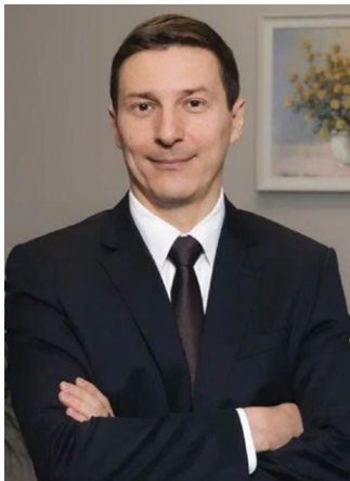
АЛЕКСЕЙ ВЛАДИМИРОВИЧ САЛТЫКОВ