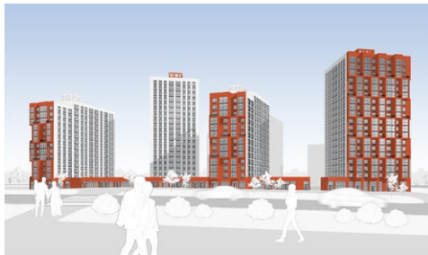
ПОПОВ ЛОГ, ЕКАТЕРИНБУРГ