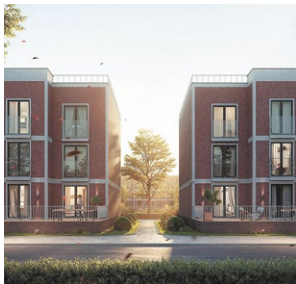
ТВОЯ ПРИВИЛЕГИЯ, ЧЕЛЯБИНСК