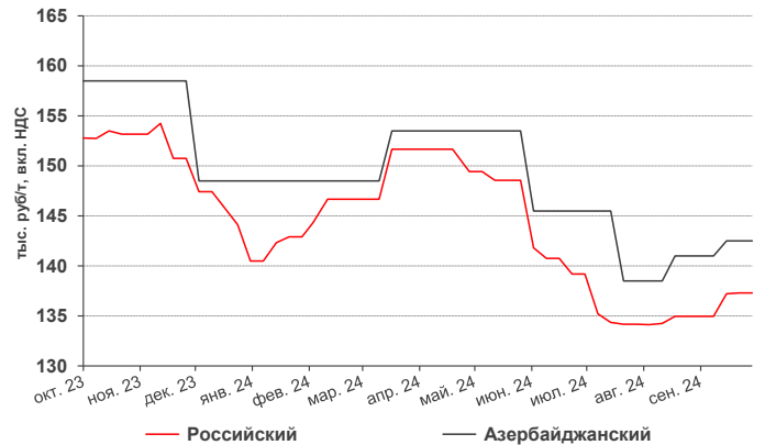
Рис.4: Динамика цен на трубный ПЭВП в РФ