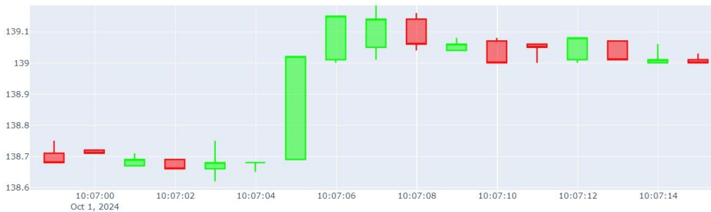
Изображение 2. График Базового актива