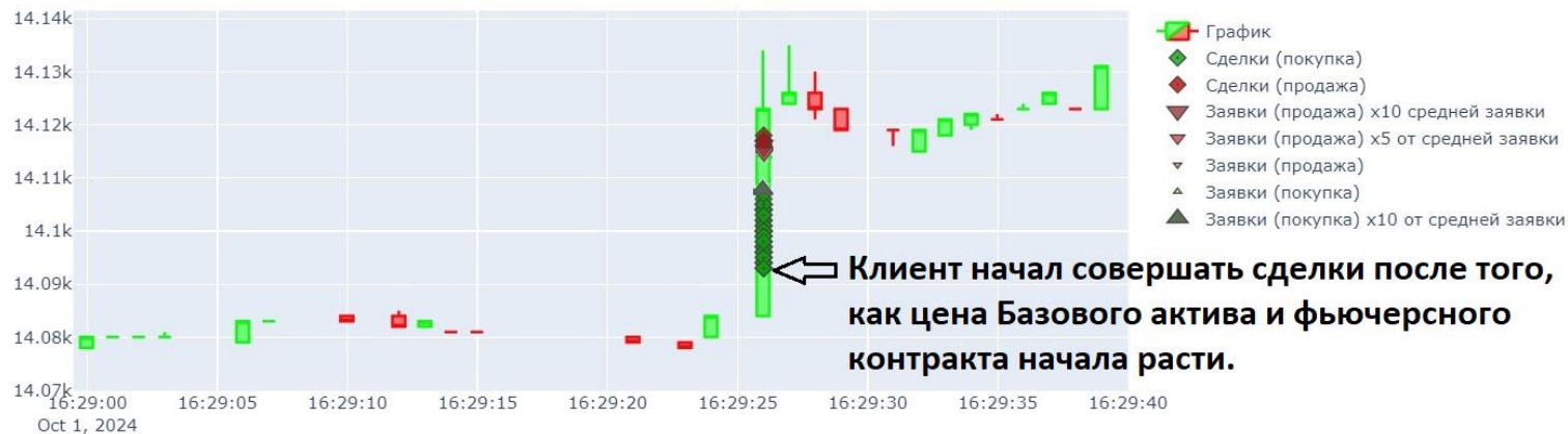
Изображение 3. График подачи Клиентом заявок и совершения сделок с фьючерсным контрактом в 16:29:26