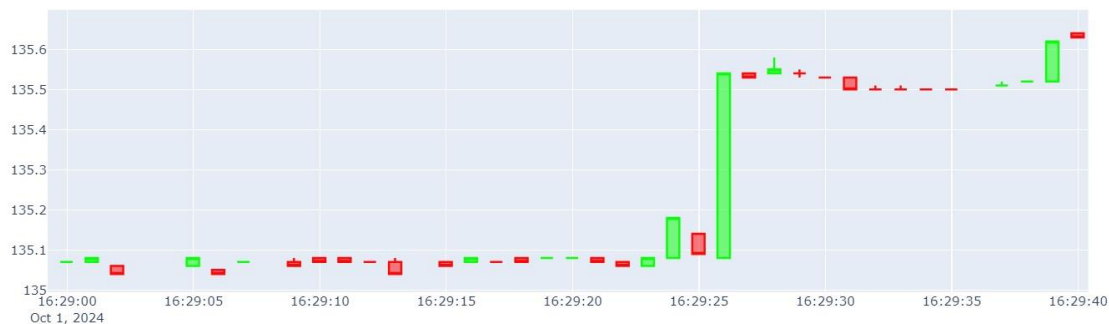
Изображение 4. График Базового актива