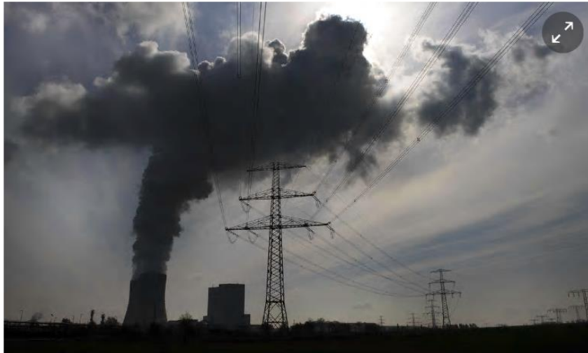
Steam and exhaust gases emitted from a coal-based power station Lippendorf, south of Leipzig, eastern Germany.

Divestment based on climate and business reasons, says German financial giant as decision is likely to affect €4bn worth of investments