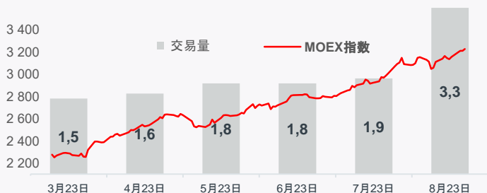
总交易量动态 · 万亿卢布