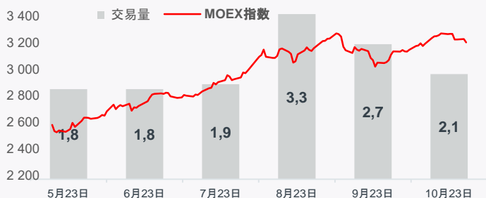
总交易量动态 · 万亿卢布