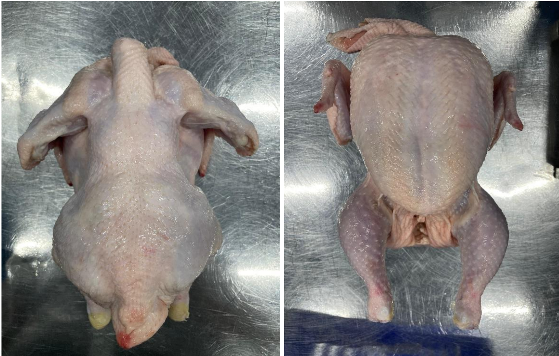
Фото продукта (внешний вид)