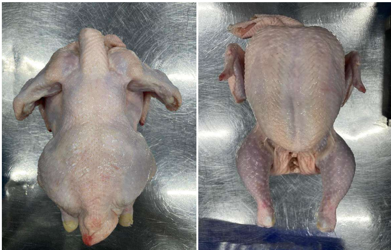
16 Фото продукта (внешний вид)

Мясо кур: тушка цыпленка-бройлера потрошенная 1 сорта охлажденная, Черкизово